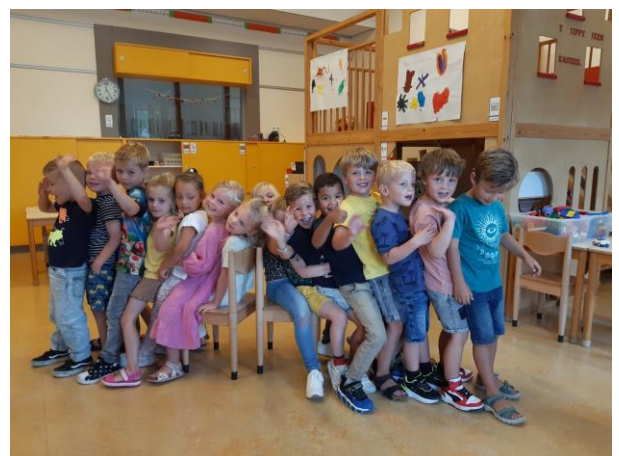
Groep 1/2 C