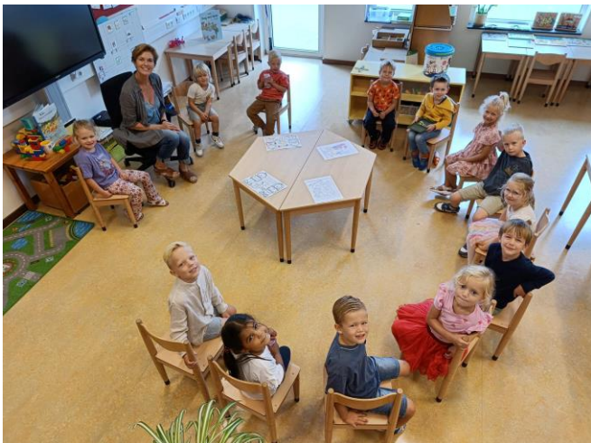
Groep 1/2 B