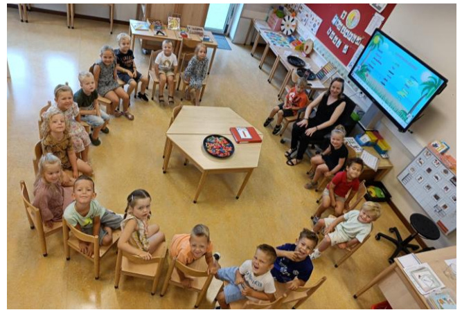
Groep 1/2 A