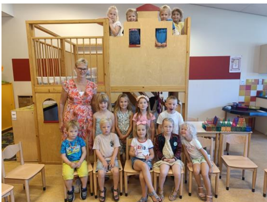
Groep 1/2 C